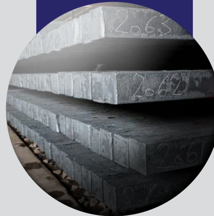
چشم انداز ملل گزارش می‌دهد