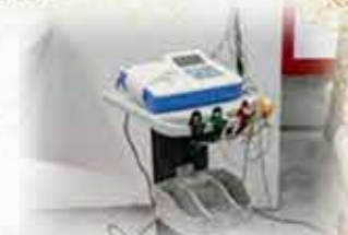
تجهیز بخش عفونی بیمارستان خاترا الانبیا و تهیه اکسیژن مورد نیاز