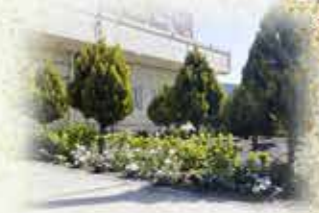
تخصیص خط لوله آب به پارک تفریحی فدک