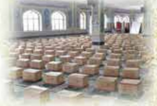
کمک به رفع خسارت سیل روستای کیسکان