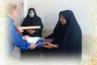
تحلیل از خانواده ایثارگران، شهداء، آزادگان، رزمندگان و جانبازان