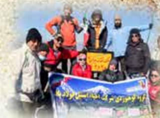
سالن‌های ورزشی، بهداشت و درمان